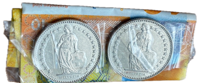
Abb.: Diese Spende einer Schülerin haben wir im Lehrerzimmer vorgefunden.

Wir können nur staunen und dankbar sein über die vielen grossen und kleinen Spenden, die in den letzten Wochen eingetroffen sind. Besonders berührend waren die Spenden von Schülern, die mit Ihrem Sackgeld die Weiterführung der Schule unterstützt haben. Neben den unzähligen Spenden sind Eltern finanziell an Ihre Schmerzgrenze gegangen, haben das Schulgeld für Ihre Kinder erhöht und sind einen bewussten Schritt des Verzichts gegangen. Zudem haben in den letzten Wochen, trotz der unsicheren Situation, Eltern Ihre Kinder an der Christlichen Schule Dübendorf angemeldet, im Glauben, dass die Schule weitergeführt wird.